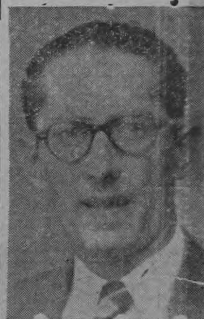
DIPUTADO ML. ANTONIO QUESADA ..de suma importancia la nueva ley de caminos públicos..

LA DISCUSION SOBRE LA REFORMA AL REGLAMENTO INTERNO DE LA ASAMBLEA LEGISLATIVA (TEXTO EN PAG. 3)