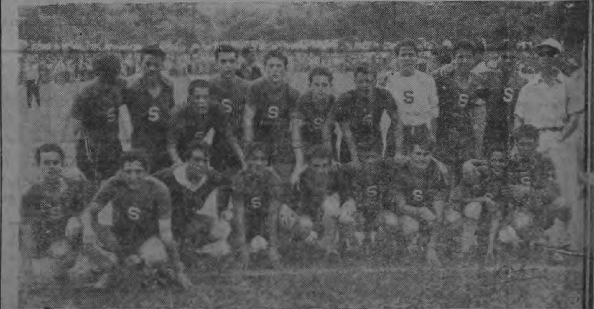
SE ENFRENTA A GIMNASTICA:—Departivo Saprissa quien el domingo tendrá que enfrentarse a la Sociedad Gimnástica Española por la Copa Costa Rica.

La segunda división apenas celebrará su primer partido, ya que acaba de integrarse, pero no dudamos que estos muchachos tratarán de imitar el magnífico juego de conjunto que desarrollan sus hermanos mayores de primeras. Buena suerte.